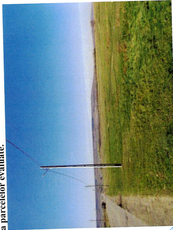
Foto 3: Vedere teren dinspre est, în zona NC56130. LEA 0,4 kV paralela cu drumul comunal (str. Moldovei) pe terenurile evaluate.