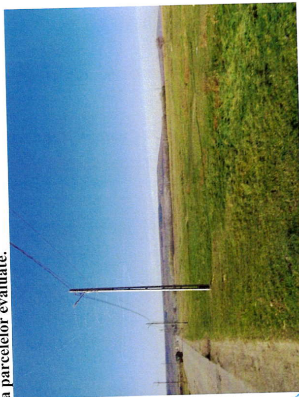
Foto 3: Vedere teren dinspre est, în zona NC56130. LEA 0,4 kV paralela cu drumul comunal (str. Moldovei) pe terenurile evaluate.