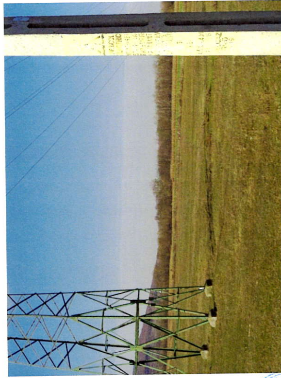
Foto 7: Stalp metalic LEA 110 kV in zona NC56133. Induce restrictii de construire si de utilizare in culoarul LEA.