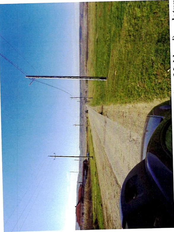
Foto 1: Drum comunal de acces (str. Moldovei) pe latura de sud a parcelelor evaluate.

Anexa 4: Foto Evaluare 2025 teren extravilan NC53905 Gherăești, NC53905 dezmembrat în 4 parcele (NC56130, NC56131, NC56132, NC56133), Proprietar UAT Gherăești, jud. Neamț