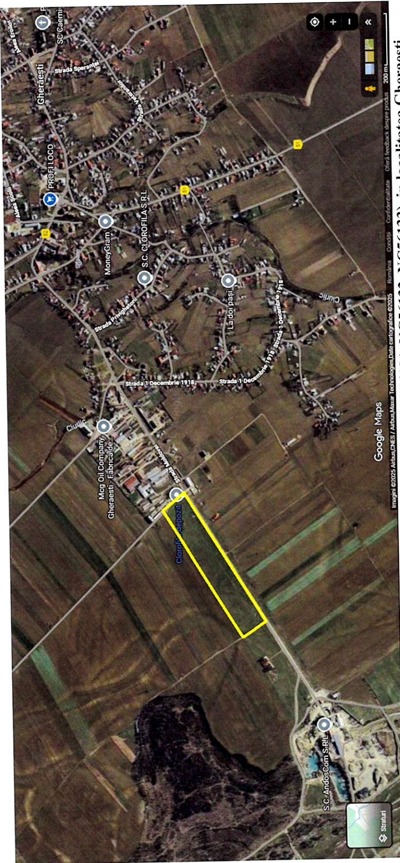
Situare teren NC53905 dezmembrat in 4 parcele (NC56130, NC56131, NC56132, NC56133), in localitatea Gherăești