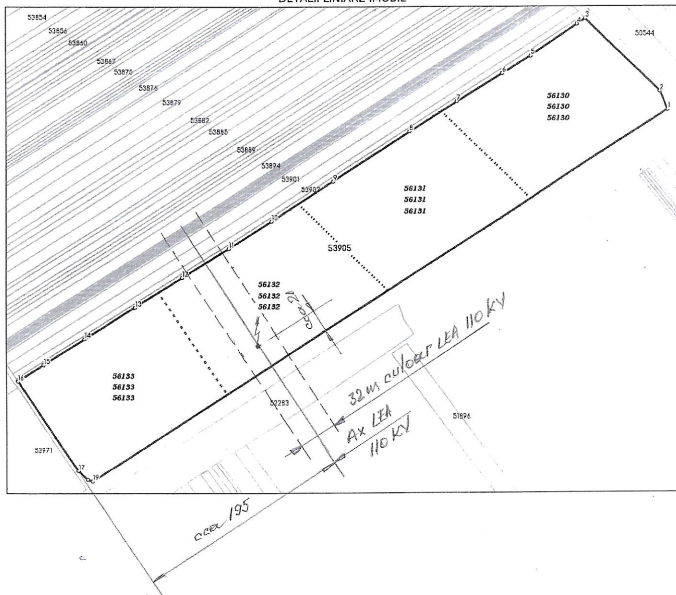
DETALII LINIARE IMOBIL

* Suprafața este determinată in planul de proiecție Stereo 70.